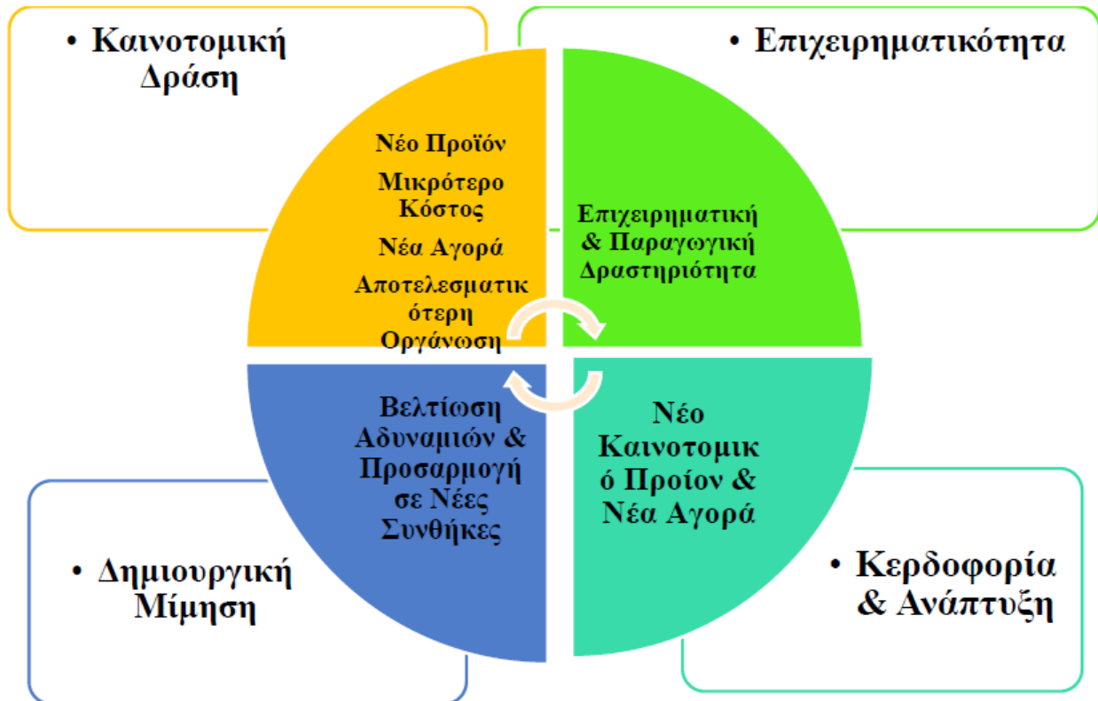
Διάγραμμα 3.2 Καινοτομική & επιχειρηματική δραστηριότητα & ανάπτυξη (Schumpeter)

Στην οικονομική επιστήμη, ως επιστημονική γνώση ορίζεται εκείνη που μπορούν να την αποκτήσουν όλα τα άτομα χωρίς αποκλεισμούς. Η βασική έρευνα οδηγεί σε εφευρέσεις και ανακαλύψεις που αυξάνουν την επιστημονική γνώση, ενώ η εφαρμοσμένη έρευνα οδηγεί στη βελτίωση των τεχνικών πρακτικών και στη βελτίωση της παραγωγικής διαδικασίας. Η καινοτομία μπορεί να οριστεί ως η εφαρμογή και η πρακτική μεταφορά μιας νέας ιδέας στη παραγωγική διαδικασία. Σήμερα οι περισσότερες καινοτομίες αναπτύσσονται από επιστήμονες που εργάζονται σε ερευνητικά και πανεπιστημιακά ιδρύματα και πολλές φορές χρηματοδοτούνται από μεγάλες επιχειρήσεις. Στο Διάγραμμα 3.2 παρουσιάζεται το πλαίσιο της επιχειρηματικής, παραγωγικής και καινοτομικής δραστηριότητας, η δημιουργική μίμηση και τα αναπτυξιακά αποτελέσματα σύμφωνα με τον Schumpeter.