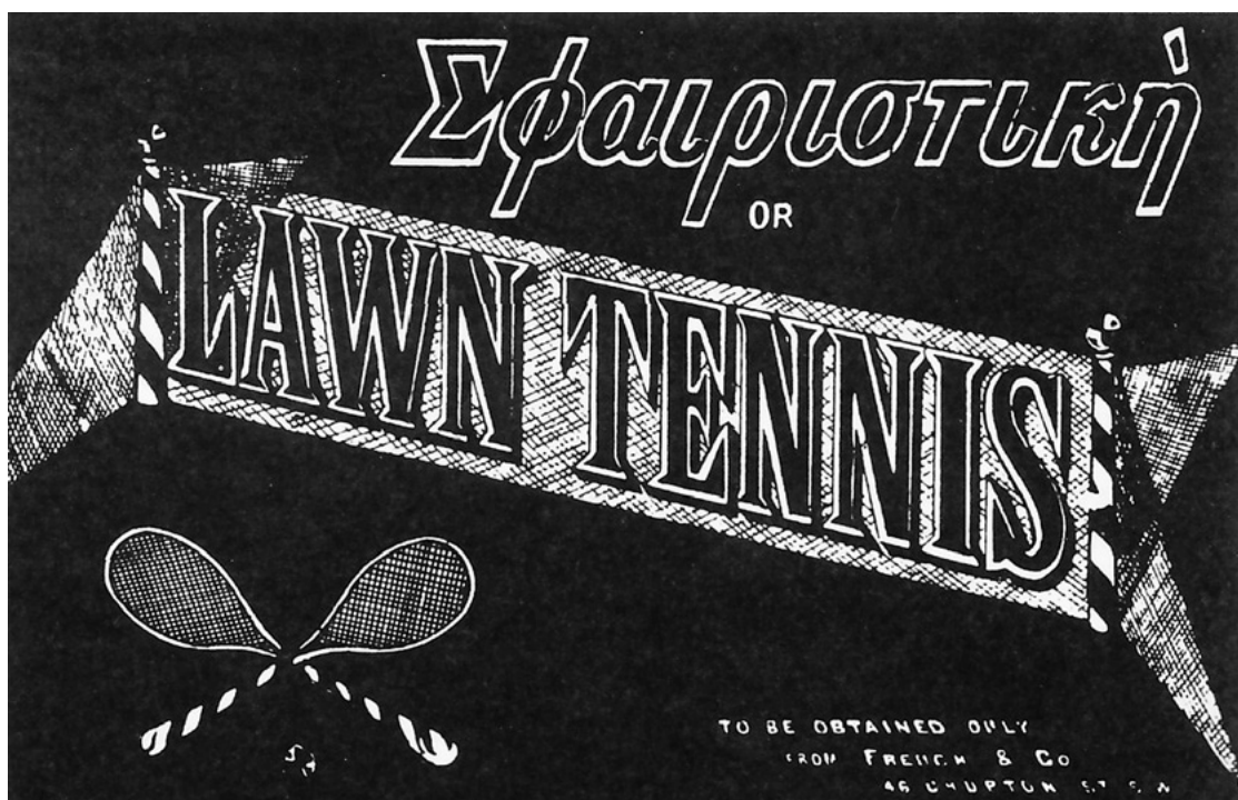
Εικόνα 1.1 Το εξώφυλλο του πρώτου βιβλίου αντισφαίρισης

Το τουρνουά διεξήχθη με νέους κανονισμούς που όρισε η Επιτροπή Αγώνων, οι οποίοι ουσιαστικά παραμένουν σε ισχύ από τότε. Το σχήμα του γηπέδου από κλειψύδρα έγινε ορθογώνιο, διαστάσεων 23,77 x 8,23 μ., ενώ το ύψος του δικτυού ορίστηκε στα 1,52 μ. στις άκρες και 0,99 μ. στο κέντρο (το ύψος μειώθηκε στο 1,07 μ. στις άκρες το 1882). Το σύστημα μέτρησης αντικαταστάθηκε από αυτό του ριάλ τένις (ίδιο όπως σήμερα), ενώ καθιερώθηκε η χρήση του δεύτερου σερβίς.