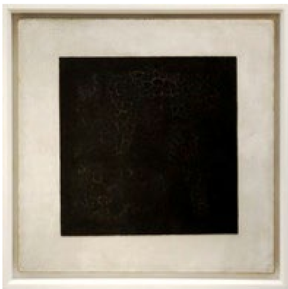
Εικόνα 1.2 Kazimir Malevich: Μαύρο τετράγωνο πάνω σε άσπρη βάση, φωτογραφημένο από τον ίδιο (1915).

Η προσπάθεια να δημιουργηθεί ένα στατικό σύστημα που θα περιγράφει τη λογοτεχνία δεν έχει πλήρως εγκαταλειφθεί. Εν τούτοις, η λογοτεχνική έκφραση φαίνεται να αντιστέκεται στην κατηγοριοποίηση, να διαφεύγει των ορισμών, να ανθίσταται στην ταξινόμηση. Έτσι, στη διάρκεια του χρόνου αναφύονται όχι μόνο νέα είδη και αναμειγνύονται με άλλα παλαιότερα μεταβάλλοντάς τα, αλλά και η εκάστοτε πρωτοπορία συνίσταται συχνά στην αμφισβήτηση παραδοσιακών λογοτεχνικών ειδών, στην αμφισβήτηση παραδομένων μορφών και κανόνων, καθιστώντας τις παλαιότερες κατηγοριοποιήσεις κειμένων προβληματικές και έωλες.