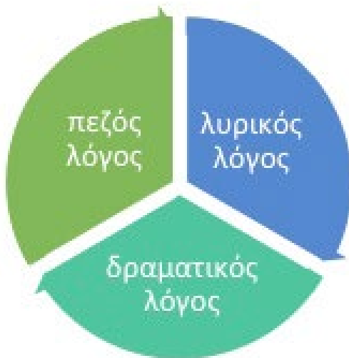
Σχήμα 1.1 Τα λογοτεχνικά γένη.

Προτού όμως εξηγήσουμε την αναγκαιότητα ταξινόμησης και κατηγοριοποίησης της λογοτεχνικής παραγωγής σε είδη/γένη, προτού δηλαδή εξηγήσουμε γιατί χρειαζόμαστε την «τακτοποίηση» της λογοτεχνίας στις εν λόγω κατηγορίες και με ποιους τρόπους πραγματοποιείται, είναι σημαντικό να επιστημονούμε την ιστορικότητα αυτής της ταξινόμησης.